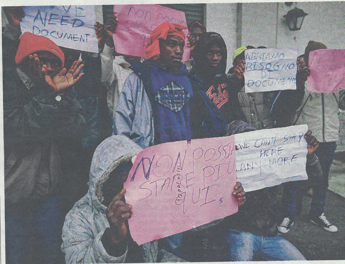
■ Protesta a Stradella dei profughi ospitati nel centro di smistamento. Una sessantina di loro hanno manifestato di fronte alla caserma dei carabinieri, chiedendo il rilascio dei documenti necessari per partire e denunciando la situazione del centro, in particolare il freddo all'interno del capannone. ■ SERVIZIO A PAGINA 52

Protesta dei profughi: abbiamo freddo, fateci partire