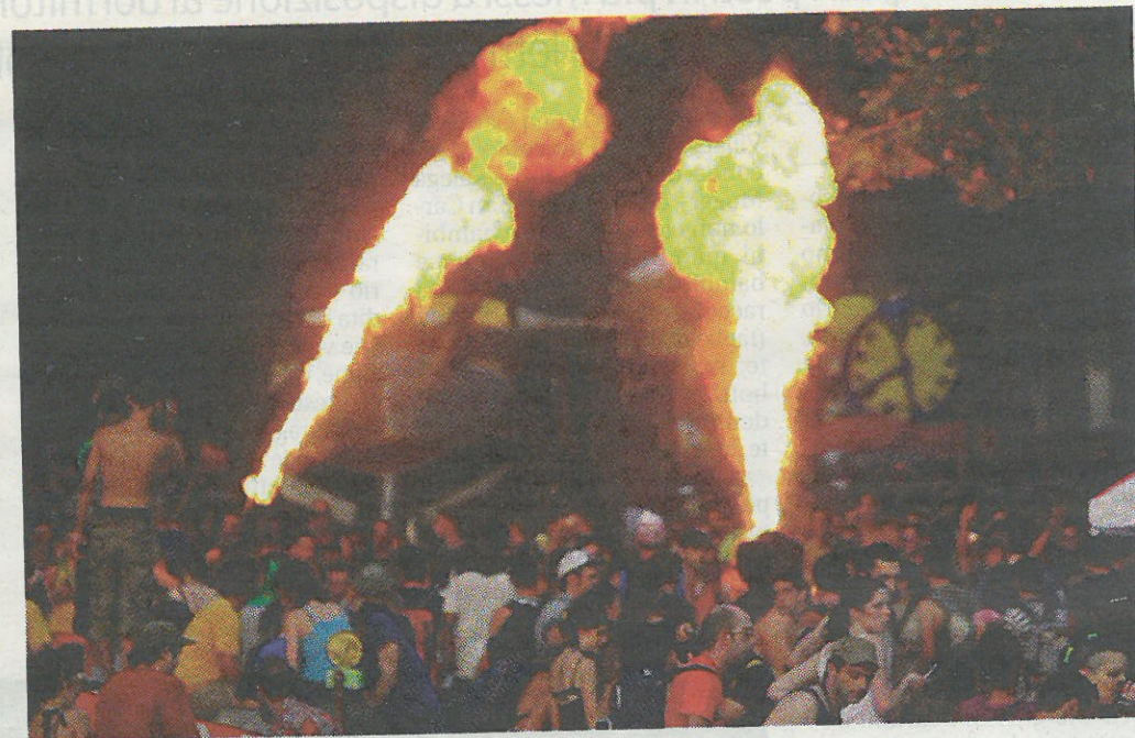
Un rave party, festa estrema dedicata alla musica techno

occupato abusivamente l'edificio. Lui fa parte del gruppo «Proprietà privata Riot club». I giovani, non è da escludere che ci fossero altri pavesi, aveva occupato il capannone dove era stato organizzato una rave party improvvisata che è proseguito sino alla mattina