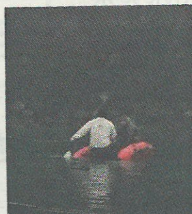
■ SERVIZIO A PAGINA 59 ■ "pirati" fotografati sul Po

Pescatori sportivi minacciati dai "pirati del Po". E' accaduto nella zona dell'oleodotto Eni di Mezzana Bigli a tre amici impegnati sabato in una battuta di pesca. Sul fiume sono comparsi due gommoni, ciascuno con a bordo due uomini, che li hanno pesantemente minacciati. Il sospetto è che si tratti di pescatori di frodo.